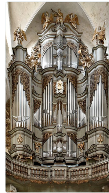
Jakobi-Organ St. Jakob

Erbaut 1653 – 1659 durch Friedrich Stellwagen aus Lübeck 2004 – 2008 Restaurierung durch Orgelwerkstatt Kristian Wegscheider, Hans van Rossum, Gunter Böhme