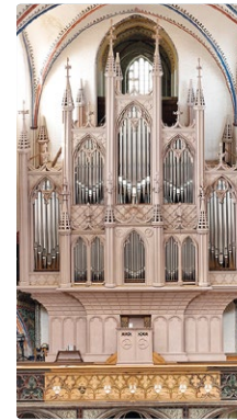
Buchholz-Organ St. Nikolai